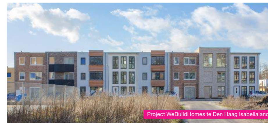
Project WeBuildHomes te Den Haag Isabellaland