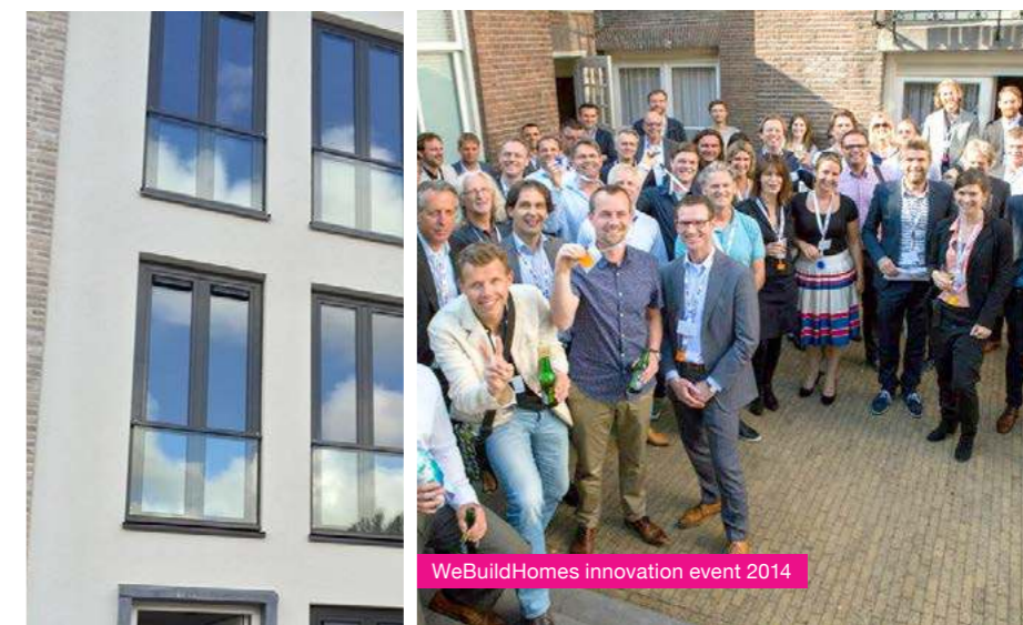
WeBuildHomes innovation event 2014